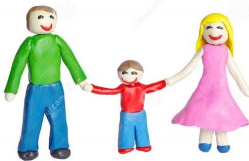
Familias en masa