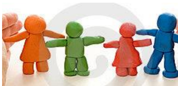
Familias en greda